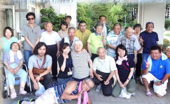
訓練生の方と一緒にパチリ📷