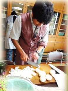
調理実習で 昼食作り中...